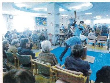
「よいしょ」「よいしょ」の掛け声で 盛り上がっています。