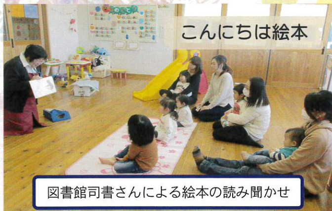
図書館司書さんによる絵本の読み聞かせ