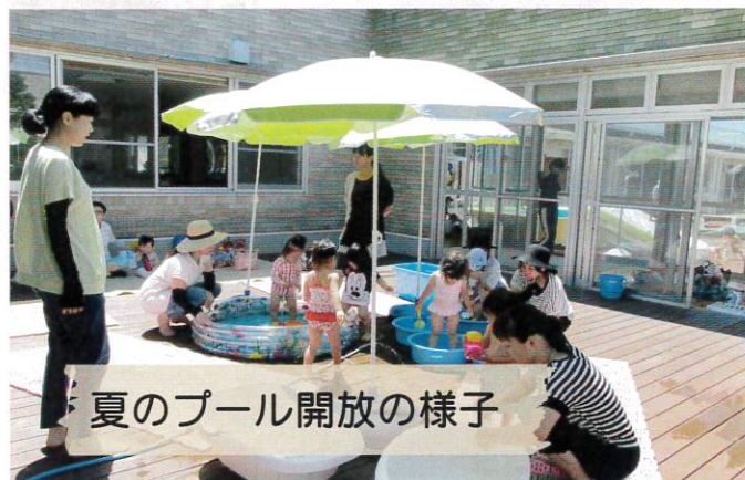
夏のプール開放の様子

月に1度、同じ学年のお友達が 集まります。体操教室・ヨガ・リト ミック・各種講座なども行います。