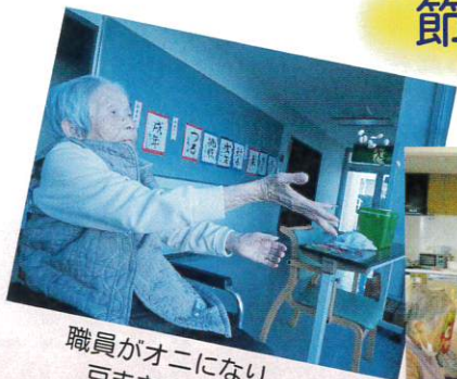
職員がオニになり、 豆まきをして福を呼びます。