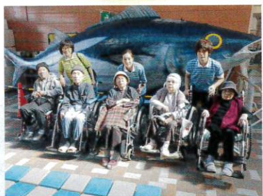
御前崎 「なぶら館」に行ってきました。