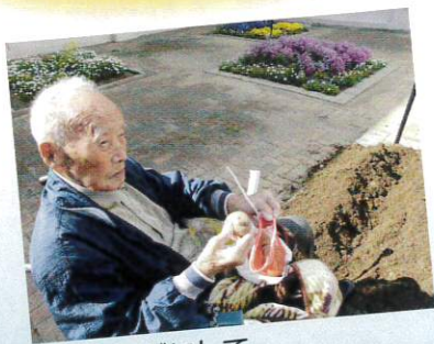
肉じゃがにして おいしくいただきました。