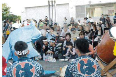
おおすか苑に山車がやっ てきました(練り)