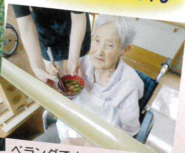
ベランダでナスやゴーヤが たくさん収穫できました。