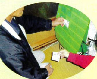
ご本人と一緒に薬を確認しセットしています。