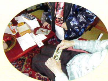
買い物支援を行っています。ご本人に確認して頂いてます。