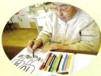
おやつを召し上がります。