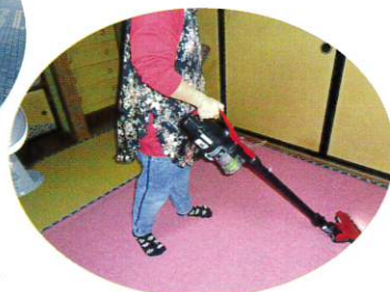
ご自宅の掃除を支援しています。