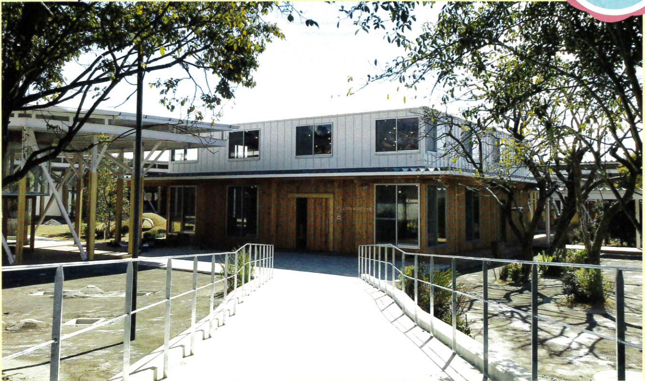
よこすか めく森こども園