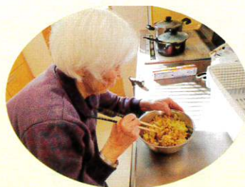
食事の前には、口腔体操を行います。